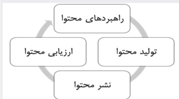
شکل ۱: فرایندهای محتوایی

۴. ارزیابی محتوا: پس از عرضه محتوا، با استفاده از ابزارهای گوناگون فنی و نیز تخصص نیروهای ماهر، بازخوردهای استفاده‌کنندگان گردآوری می‌شود و برای اصلاح، تقویت و حذف محتواهای خاص، برنامه‌های لازم تدوین می‌گردد.