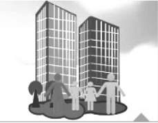
فرهنگ آپارتمان نشینی