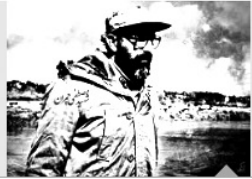
قهرمان علم و جهاد (سال روز شهادت دکتر مصطفی چمران)