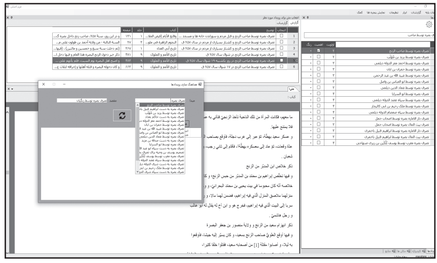
تصویر شماره ۱: هماهنگ‌سازی رویدادها

البته انواع دیگری از اشکال ثبت یک رویداد با عناوین متفاوت وجود دارد؛ مثل ثبت رویداد «وفات ابو الحسن ماوردی»؛ در اینجا محققى ممکن است به‌صورت «وفات علی بن محمد ماوردی» ثبت کرده باشد و یا مثلاً ثبت رویداد «تصرف تاشکند» که نام متأخر این شهر است، به جای «تصرف چاچ» یا معرّب آن؛ در تمامی این موارد، ناظر بازبین موظف به یکسان‌سازی چنین رویدادهایی است. (تصویر شماره ۱)