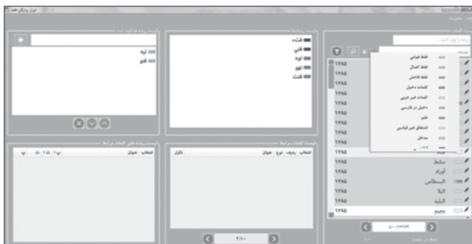
تصویر شماره ۲: نمونه‌ای از ابزار واژگان استفاده شده در مرکز نور

از آنجاکه میان برخی از لغت‌نامه‌های ساماندهی شده در بانک مداخل، واژه‌نامه‌های دوزبانه عربی فارسی همچون فرهنگ ابجدی نیز وجود دارد، امکان تفکیک توصیفات بر اساس نوع زبان نیز مهیا گردیده است. در واقع، استفاده از سه عنصر: مدخل لغوی، توصیف عربی و ترجمه فارسی و کنار هم قرار گرفتن آنها، الگویی را ایجاد خواهد کرد که می‌تواند کمک شایانی به سیستم‌های هوشمند متن‌کاوی همچون موتورهای ترجمه و ماشین‌های مشابهت‌یاب معنوی داشته باشد. دانش واژگان، مهم‌ترین مؤلفه هر زبان برای فراگیران و مترجمان است و بیشترین خطای پیش‌آمده برای پژوهشگران انسانی و ماشین‌های ترجمه نیز در همین ناحیه است (Al-sohbbani Yehia Ahmed and Muthan-)