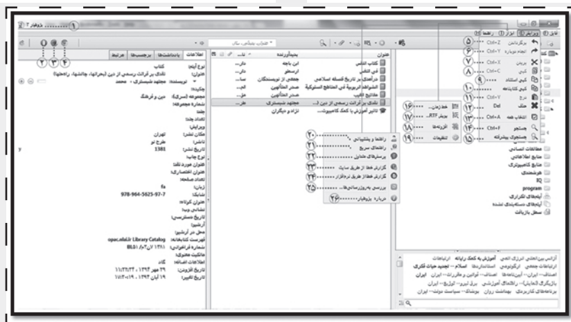
شکل ۱: نمایی از قاب پژوهیار ۲

با امکانات بیشتر و قابلیت منحصربه‌فرد است که در مرورگرهای فایرفاکس، کروم و اپرا قابل نصب و استفاده است؛ به گونه‌ای که کاربران قادر هستند از پایگاه‌های اطلاعاتی قابل درون‌برد پژوهیار از مرورگرهای ذکر شده، به ذخیره برخط اطلاعات از پایگاه‌های داخلی و خارجی واکاوی شده خود بپردازند. این نرم‌افزار، ارتباط هوشمند با شیوه جست‌وجوی کاربر در سطح وب دارد و اطلاعات را علاوه بر مرورگرهای مختلف، در فضای «ابَر پژوهیار» نیز می‌تواند ذخیره کند.